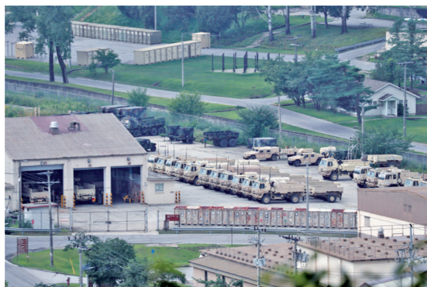
韩国东豆川美军基地停放大量军用车,照片拍摄于2021年8月3日

8月16日至26日,美韩2021年度夏季联合军演在周边国家的一片反对声中举行。此次演习主要以电脑模拟方式进行,分为“危机管理参谋训练”和“联合指挥所演习”两个阶段,前者重在进行防御,后者重在组织反击,目的是检验美韩双方应对潜在突发事件的能力。考虑到新冠肺炎疫情,美韩两军仅出动必要人员参加演习,规模较上半年春季联合军演大幅缩小。