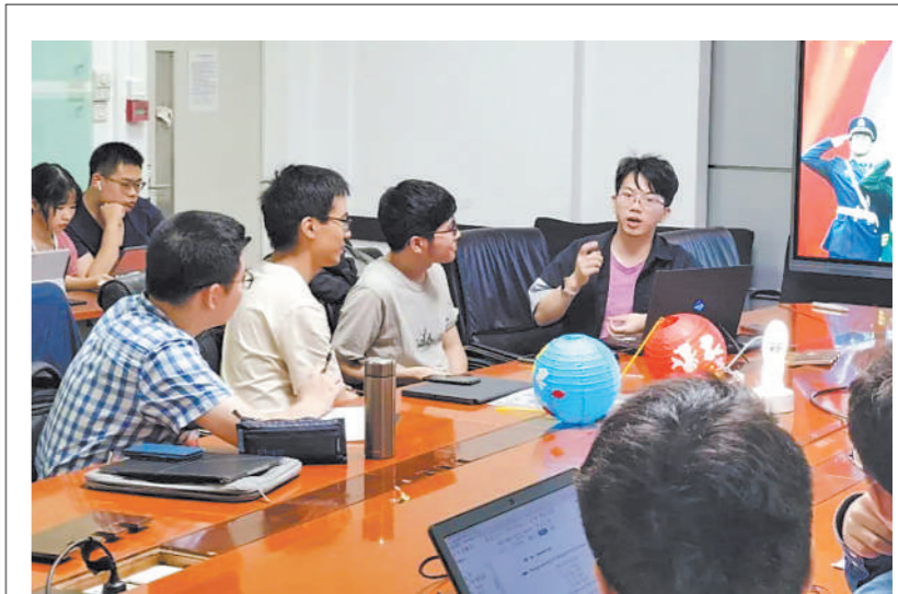
本报讯 韩瑞报道:“当你足够强大,战争就不会叩响你的门环。”国庆节前夕,在清华大学举办的国防讲堂上,该校国际关系学系教授、博士生导师吴大辉的精彩报告赢得阵阵掌声。

“广大退役军人冲锋在前,主动亮身份、做表率、当先锋、树形象,在服务国家、奉献社会、凝聚群众中提升思想境界、激发奋斗精神,用实际行动打造‘中国退役军人志愿服务’品牌,成为深圳特区又一张亮丽的名片。”广东省退役军人事务厅厅长陈小山这样评价。