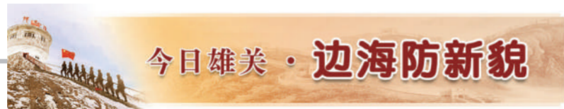
今日雄美·边海防新貌