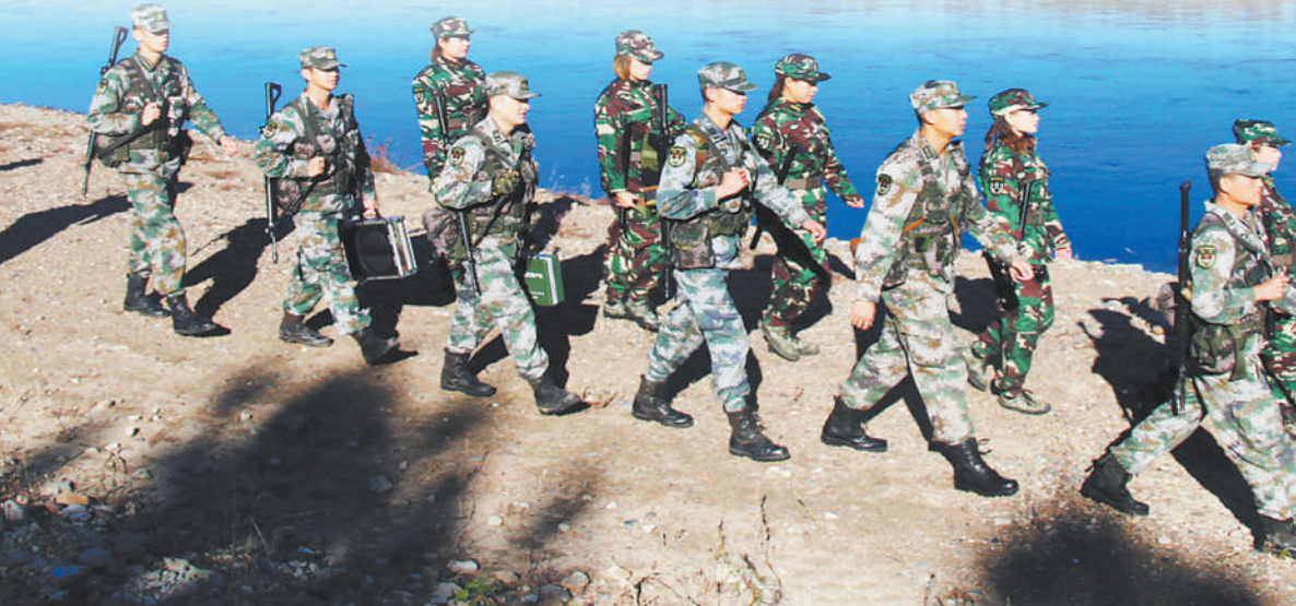
图⑤:9月21日,陆军某边防旅官兵与民兵联合巡逻。

该旅领导介绍,今年以来,他们多次协助友邻单位监控海上走私、人员偷渡等违法案件,有力维护了海防一线的管理秩序和安全稳定。