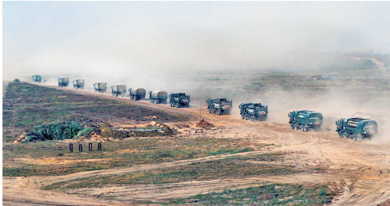
俄白“西部-2021”联合战略演习现场

此外,与北约关系密切的乌克兰也动作频频。乌克兰总统泽连斯基所在的人民公仆党议员叶戈尔·切尔涅夫10月5日声称,在与白俄罗斯关系恶化