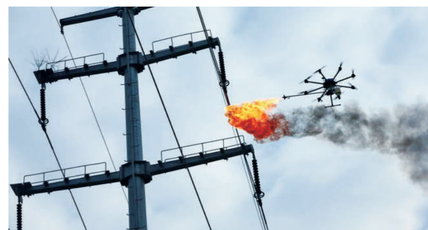
俄军无人机喷火系统与民用型类似,图为民用无人机喷火系统

俄军事专家维克多·穆拉霍夫斯基认为,无人机喷火系统一旦服役,将大大提高俄军三防部队快速摧毁城市目标和隐藏在山地或掩体中目标的能力,减少己方战斗损失。穆拉霍夫斯基表示:“这款无人机系统将有效打击敌后方重要设施、弹药库、燃料库、通信枢纽以及无防护的指挥所等。”