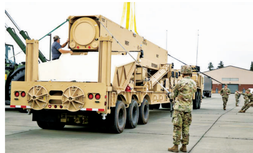
美陆军第17野战炮兵旅第3团第5营接收首批高超音速导弹原型弹

自2018年开始,美陆海空三军在通用高超音速武器项目上展开合作,加快了美军高超音速导弹的研发进度。此次美陆军接收首批高超音速导弹原型,表明美军这款全新武器系统距离实战部署又近了一步。与美陆军