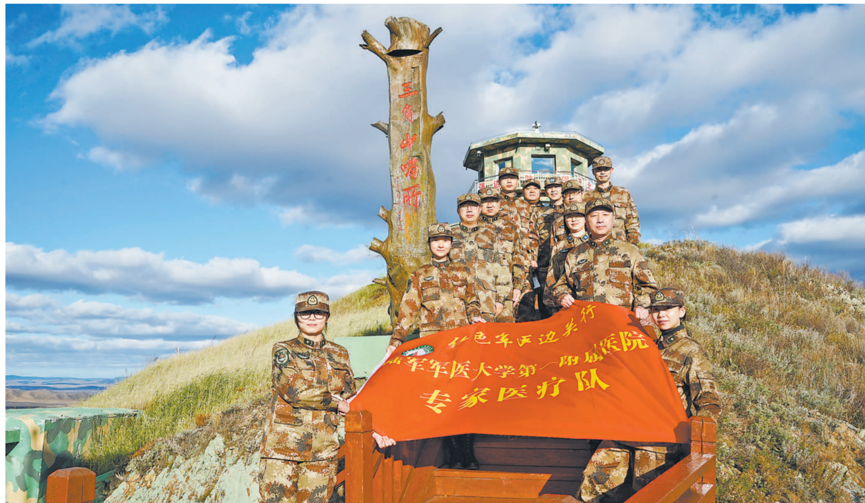
近日,陆军军医大学第一附属医院选派消化内科、运动医学中心、心理科等科室的12名专家,奔赴内蒙古边防部队,辗转上万公里,开展“红色军医进边关”活动,把优质医疗服务送到一线边防官兵。图为专家医疗队在三角山哨所前合影。