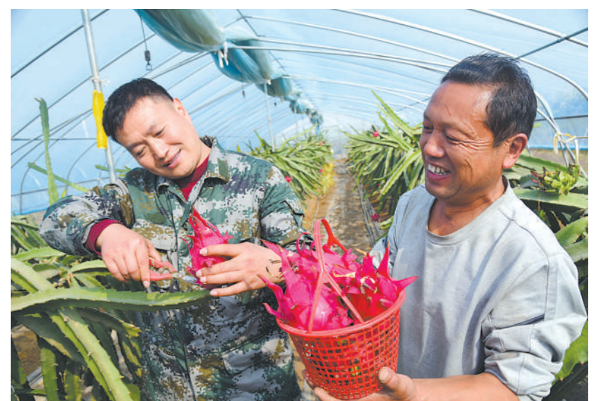
河南省杞县五里河镇土楼村在该县军武部和镇党委、镇政府的大力支持下,发展火龙果种植产业,促进了农民增收。图为10月25日土楼村村民采摘火龙果的场景。

据统计,截至目前,“巾帼宣讲团”已开展党史宣讲活动30余场,受众群体突破万余人次。