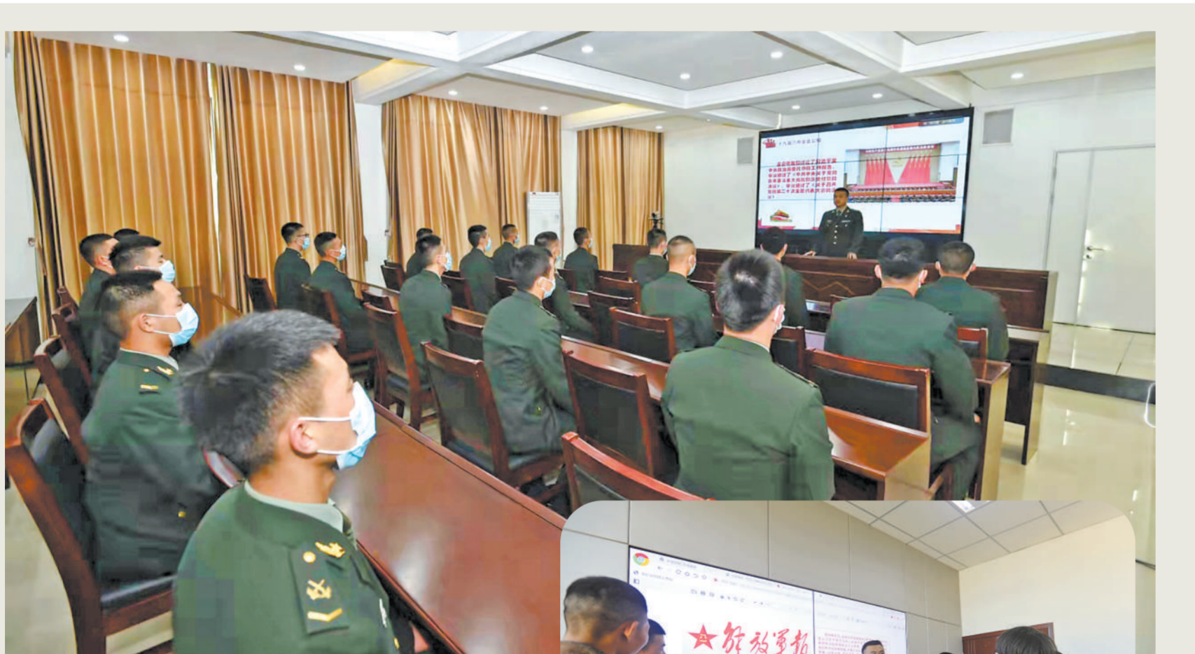
11月12日,党的十九届六中全会胜利闭幕后,各省军区通过报纸、电视、网络等媒介,及时学习领会全会精神。