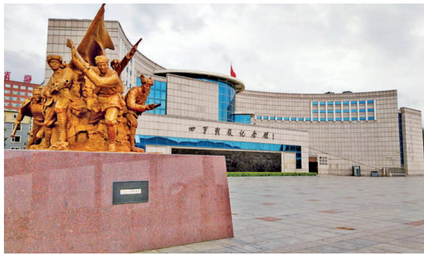
吉林省四平市四平战役纪念馆

3月12日8时许，6连随主攻部队突入城内，顺利进至玉皇庙东侧道路一线。玉皇庙敌人突然向6连猛烈射击，打乱了他们的进攻节奏。连长、副连长经过商议后，将6连分为2个攻击分队，