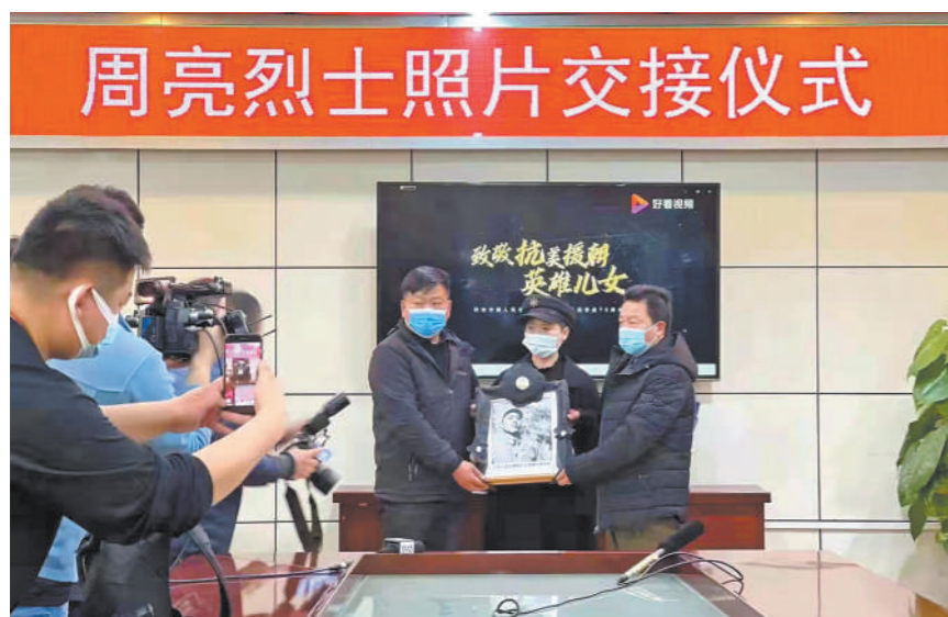
周亮烈士照片交接仪式