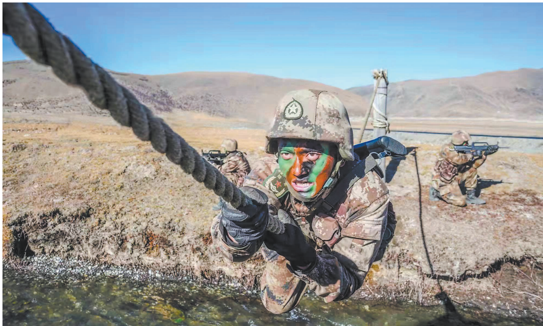
11月中旬,西藏军区某团组织官兵开展高原山地进攻演练。图为官兵进行牵引横渡课目训练。