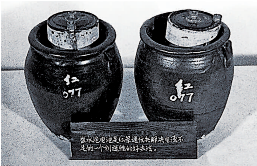
红军浸泡废电池用过的盐水瓶。

1934年，第五次反“围剿”失败后，红军主力被迫实行战略转移。面对国民党军队的围追堵截，红军电讯人员克服恶劣环境，在“看不见的战场”上进行了艰苦卓绝的斗争。长征时期的无线电情报工作，帮助红军抢占作战先机，获得战场决策优势，摆脱了国民党军的围追堵截，为红军取得长征伟大胜利作出了巨大贡献。