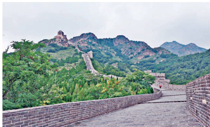
山海关之战的阵地之一角山长城。