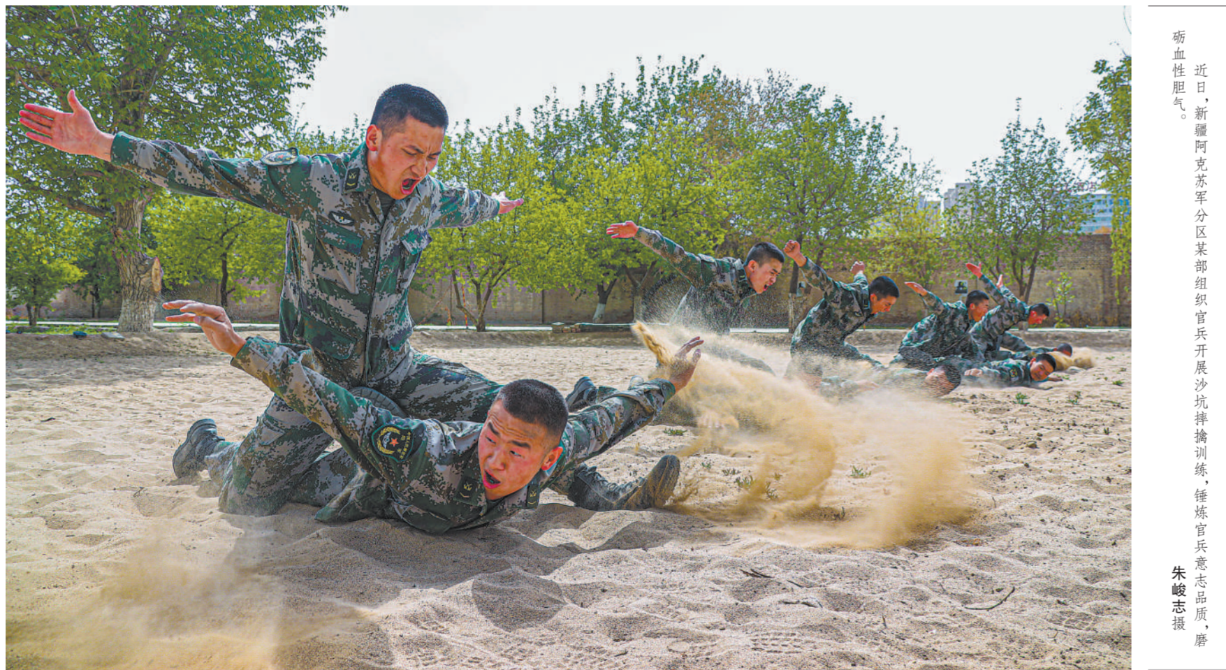
近日,新疆阿克苏军分区某部组织官兵开展沙坑摔擒训练,锤炼官兵意志品质、磨砺血性胆气。