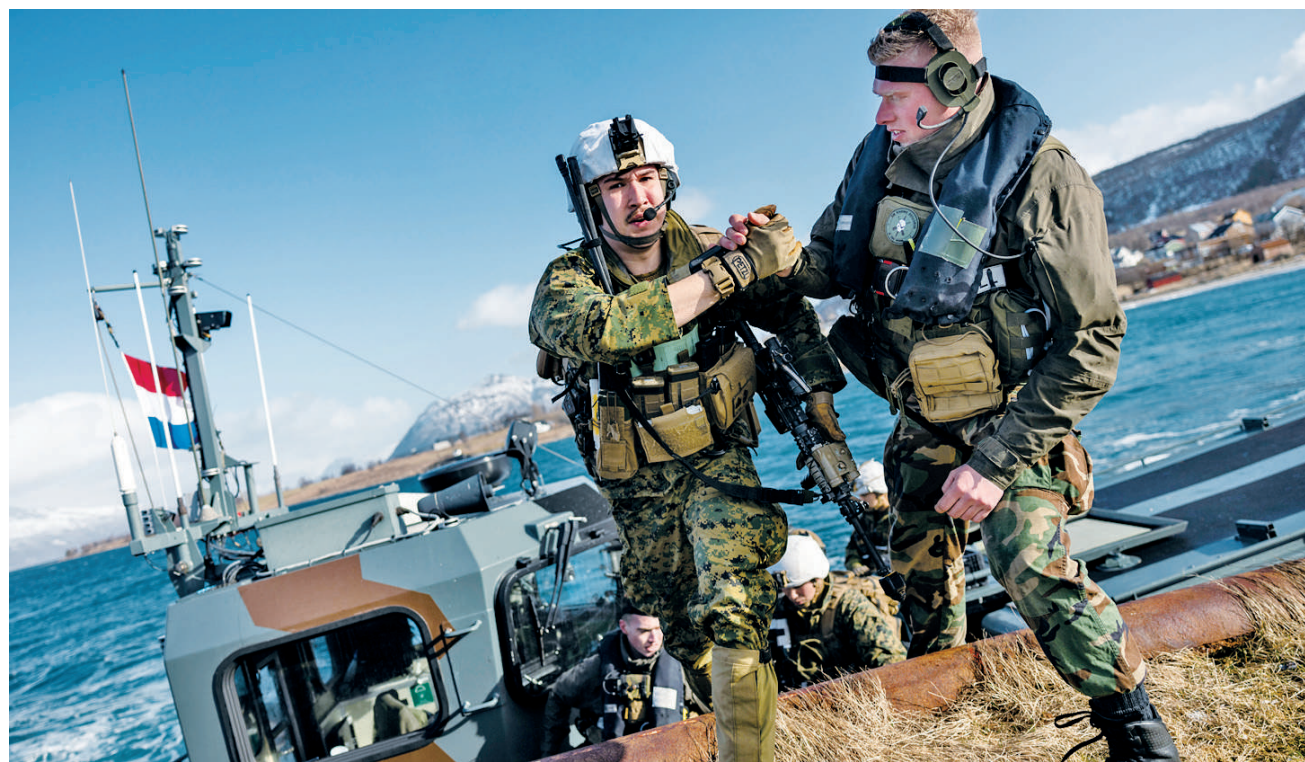
美国、法国和荷兰军队士兵在挪威参加联合军事演习。

英国国防大臣本·华莱士表示,这一系列演习将锤炼北约盟国及联合远征军的联合行动能力,旨在展示团结与力量。他说,这是自冷战结束以来,北约最大规模的共同部署行动。