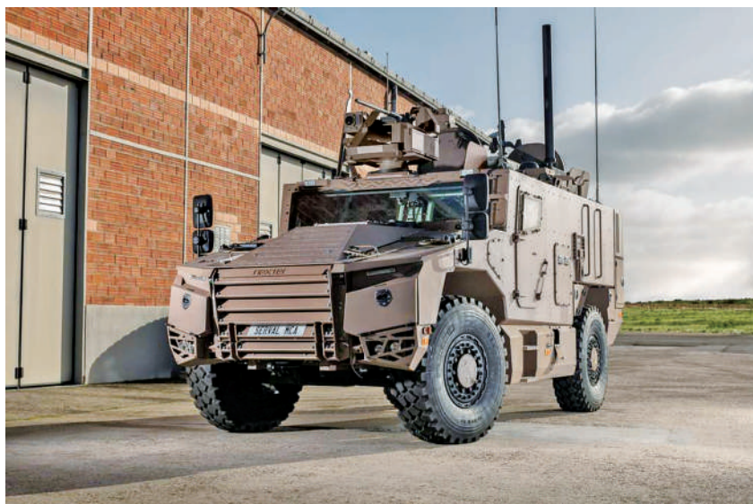
法国“豹”多功能装甲车。

作为法国陆军现代化转型计划的重要组成部分之一,“豹”多功能装甲车的人列,意味着法军网络中心作战体系建设更进一步。未来,法国陆军将依托统一的战斗管理系统,联结各类型地面作战车辆,实现各作战单位的情报信息共享,增强协同作战能力。“豹”多功能装甲车、“狮鹫”装甲运输车、“美洲豹”侦察车和升级版“勒克莱尔”主战坦克将优先纳入其网络中心作战体系,构成未来法国陆军地面作战主体。