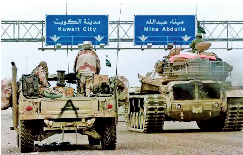
多国部队向科威特城机动。

1991年2月24日，以美军为首的多国部队发起“沙漠军刀”行动，由北线联合部队、美军第1陆战远征队和东线联合部队包围了科威特城，通过在城市外围的空地一体作战，歼灭了伊拉克军队主力，最终于27日夺回科威特城。此次城市作战重创了科威特境内的伊拉克军队，加速了第一次海湾战争进程，反映出在现代条件下平坦地区城市外围作战的新特点。