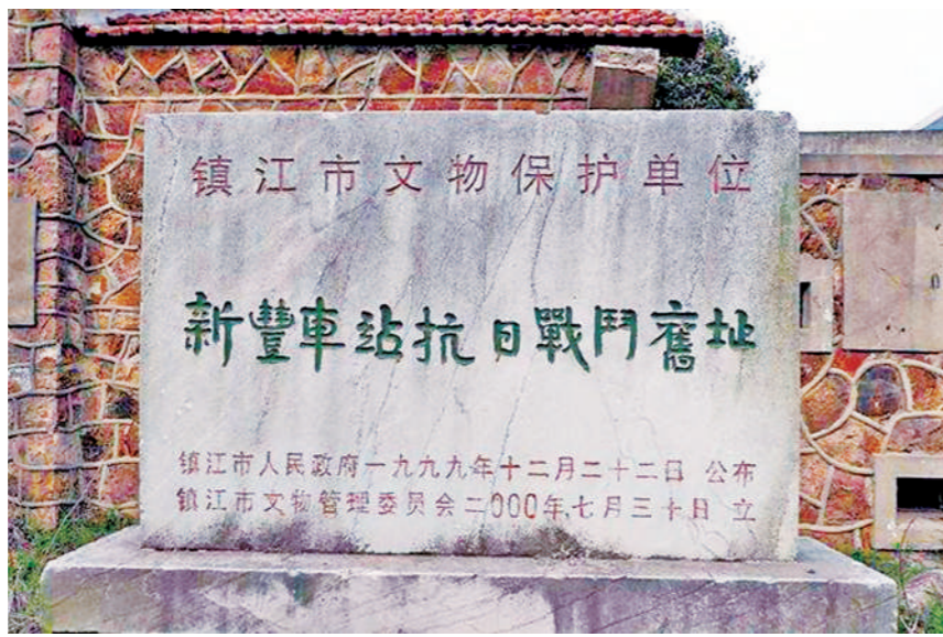
新丰车站抗日战斗旧址。

提前调查摸清敌情,精心拟制作战方案。 新丰车站在京沪铁路上镇江、丹阳之间,位于京杭大运河与京沪铁路的交叉点,是重要的水陆交通枢纽。日军高度重视,特派第15师团松野联队广江中队的一个约40人的精锐小队在此驻守,另有特务、汉奸、路警等共100余人。为打好这一仗,第2团在战前进行