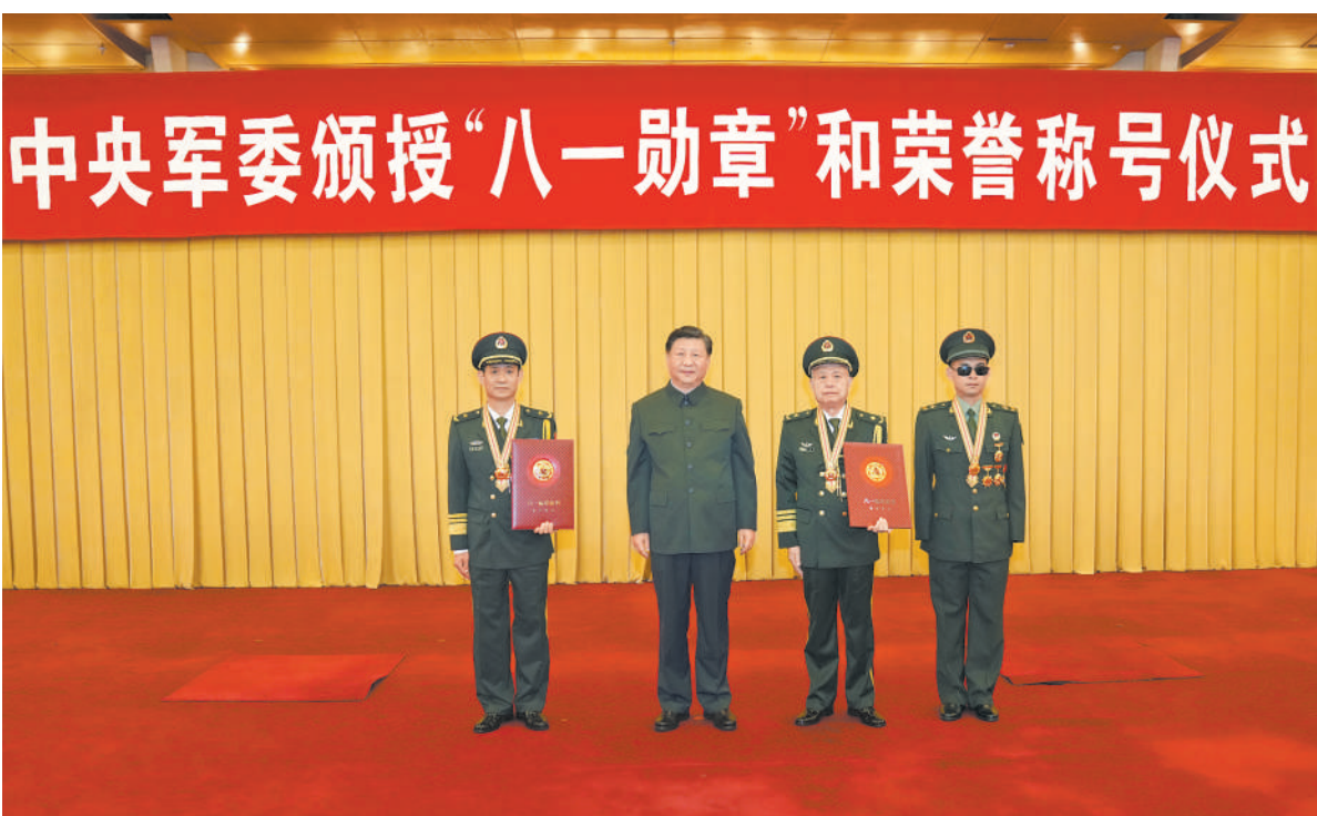
本报北京7月27日电 记者欧灿、李建文报道：在庆祝中国人民解放军建军95周年之际，中央军委27日在京隆重举行颁授“八一勋章”和荣誉称号仪式。中共中央总书记、国家主席、中央军委主席习近平向“八一勋章”获得者颁授勋章和证书，向获得荣誉称号的单位颁授荣誉奖旗。