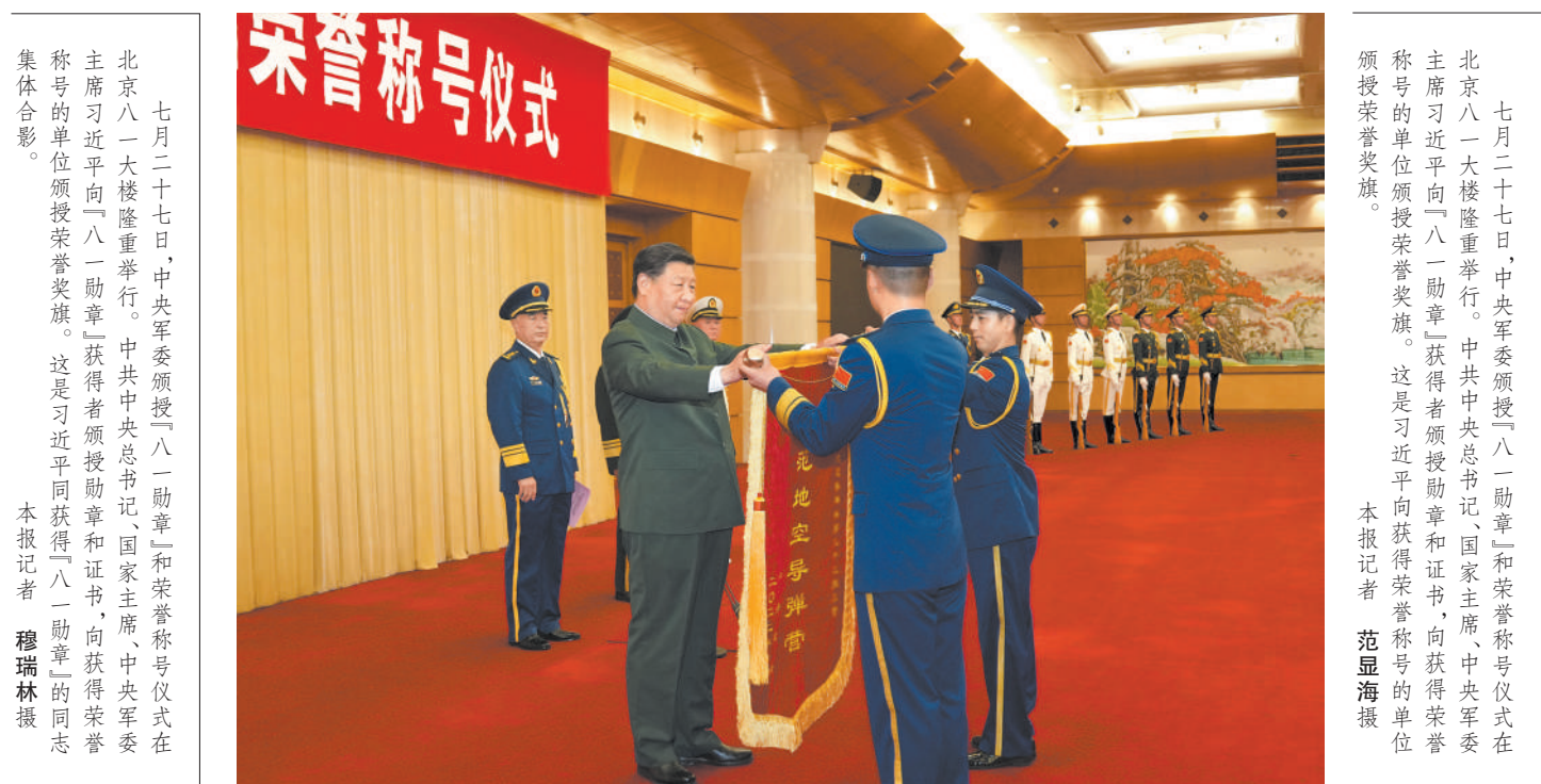
七月二十七日，中央军委颁授“八一勋章”和荣誉称号仪式在北京八一大会堂隆重举行。中共中央总书记、国家主席、中央军委主席习近平向“八一勋章”获得者颁授勋章和证书，向获得荣誉称号的单位颁授荣誉奖旗。这是习近平向获得荣誉称号的单位颁授荣誉奖旗。

张又侠主持仪式。杜富国、钱七虎、聂海胜等获得“八一勋章”的同志依次上前，习近平为他们佩戴勋章、颁发证书，同他们合影留念。随后，习近平向获得“模范地空导弹营”荣誉称号的空军地空导弹兵某部二营颁授荣誉奖旗。