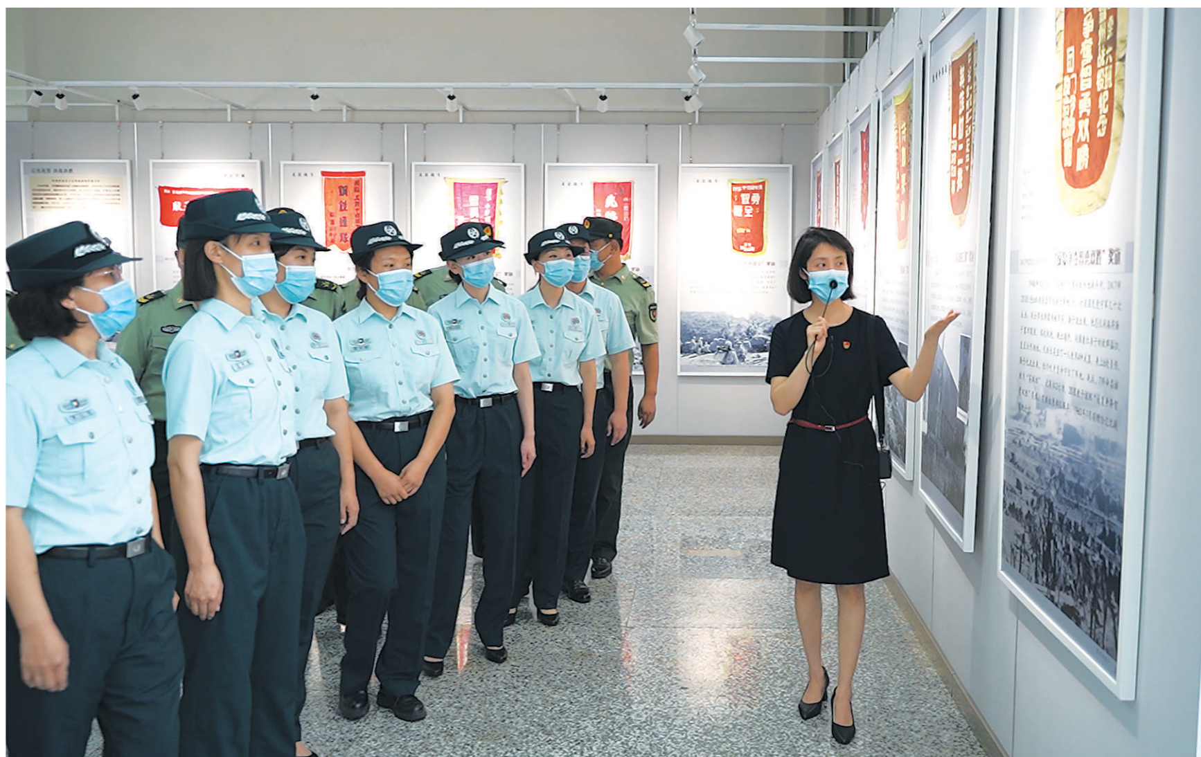
“八一”前夕，辽宁省锦州军分区联合辽沈战役纪念馆举办《战旗美如画——东北解放战争荣誉旗帜专题展览》。图为该军分区官兵参观专题展览时情景。

“向前，向前，向前，我们的队伍向太阳，脚踏着祖国的大地，背负着民族的希望……”最后，哨所官兵与远在千里之外陈月山老人通过屏幕互致军礼，并一起高唱《中国人民解放军军歌》。