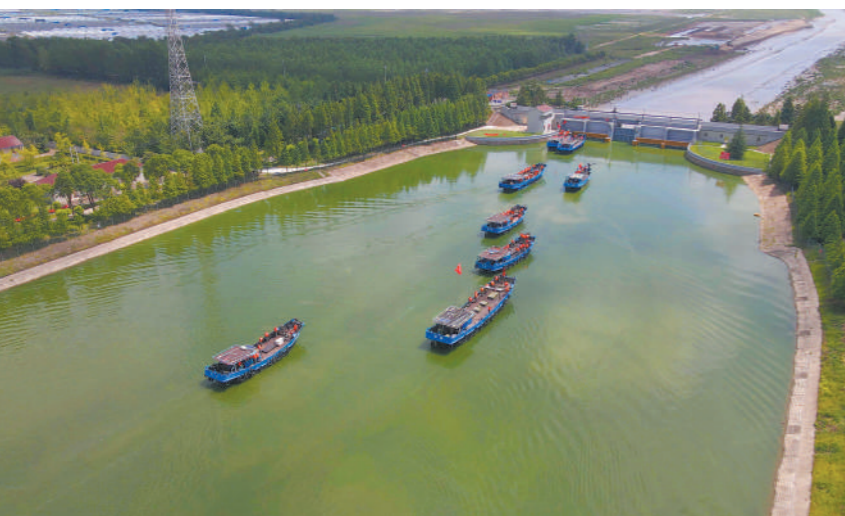
“八一”前夕，江苏省东台市组织海上民兵分队综合演练，全面检验海上民兵应急应战力量快速动员和遂行任务保障能力。图为海上民兵分队进行编队演练。