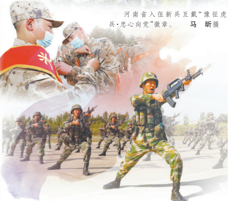
河南省入伍新兵互戴“豫征虎兵·忠心向党”徽章。