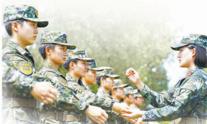
武警陕西总队新训班长为新兵纠正动作要领。

推动征兵工作规范化。印发《海南省征兵工作领导小组工作规则》《海南省人民政府征兵办公室工作规范》，发挥“党委议征、政府管征”主导作用，建立完善征兵“五率”考评体系，推动各级党委、政府依法履职。省军地纪委印发《关于加强军地联合监督执纪确保廉洁征兵的通知》，关于进一步加强对廉洁征兵工作的通知》，强化依法廉洁征兵意识，连续多年实现廉洁征兵“零投诉、零举报、零上访”。