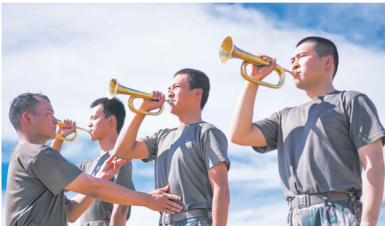
8月中旬,新疆军区某团组织司号员集训,通过相互纠正、竞赛评比、观摩取经等方式,提升司号员技术水平。图为教练员向集训队员传授经验技巧。