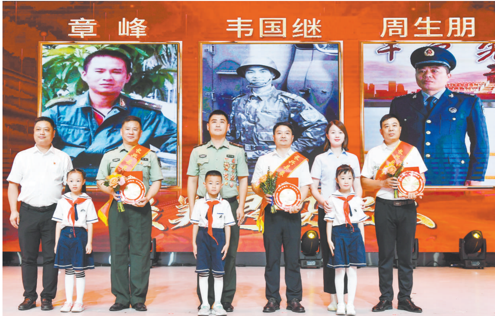
八月下旬,浙江省长兴县开展“最美退役军人”评选活动。图为获评退役军人依次上台领奖。