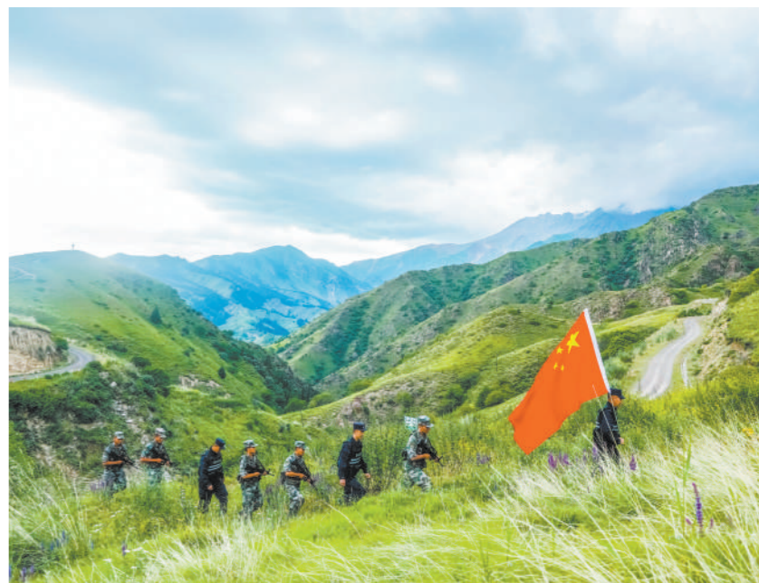
近日,新疆伊犁军分区某边防连联合红卡子边境派出所及驻地护边员组成巡逻小分队,对所辖边境山区重要沟口、重难点管控地段开展联合巡逻。

红色旅游“火”了,国防教育“热”了。据统计,2018年以来,毕节市各县(区)党政部门、企事业单位组织各类国防教育活动2500余次,在毕节参观红色景点游客达300余万人次。