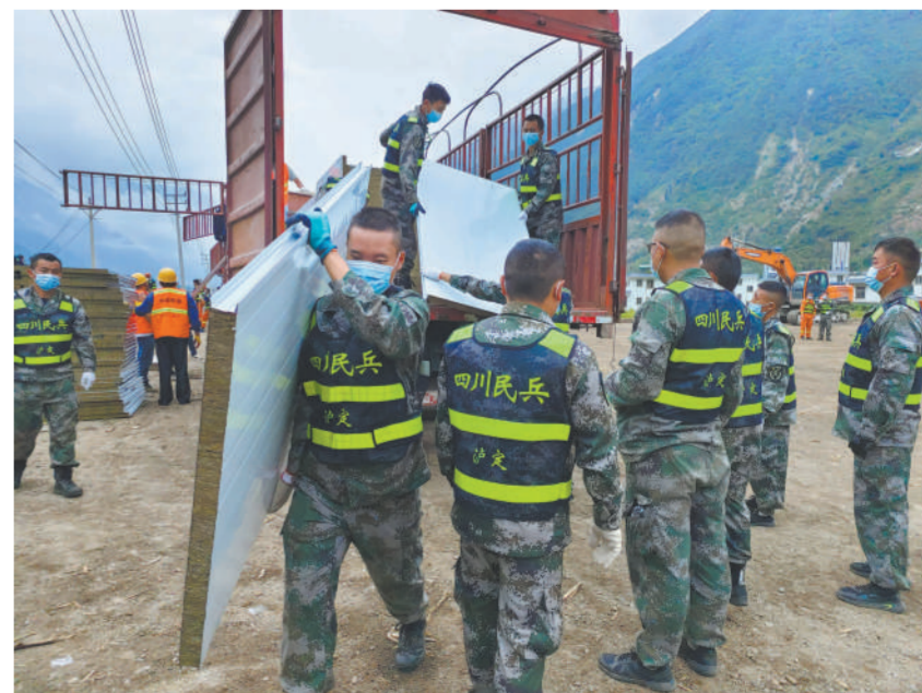
日前，四川省泸定县民武部组织民兵在得妥镇友谊村帮助地震受灾群众搭建板房，恢复生产生活秩序。

浏阳市退役军人事务局双拥优抚科负责人表示，9月底前，全市32个乡镇街道都将打造一条双拥示范街，让现役官兵、退役军人和其他优抚对象在家门口就能享受优待和优惠。