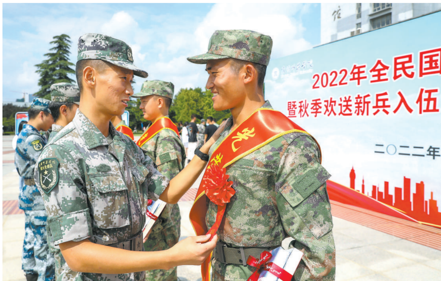
2022年全国民国暨秋季欢送新兵入伍

这10年,从“按量征集”到“对口征集”,精准征集迈出实质性步伐。军委国防动员部建立“报名率、上站率、合格率、择优率、退兵率”征兵量化考评指标体系,立起了检验征兵工作成效的硬杠杠。预定新兵役前教育训练普遍展开,帮助新兵提前适应部队的训练生活节奏,系好“第一粒扣子”。研发征兵智能