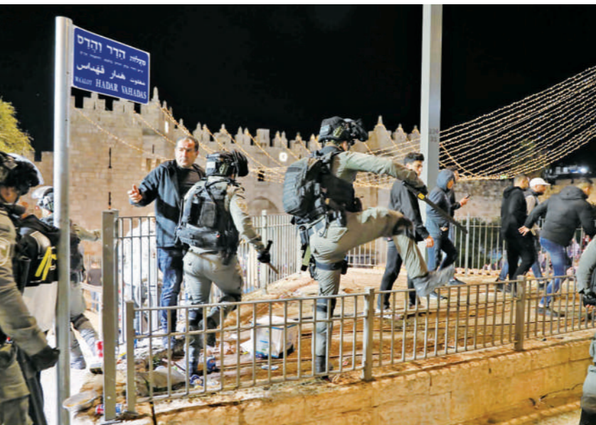
以色列军警在耶路撒冷老城大马士革门外驱散人群。