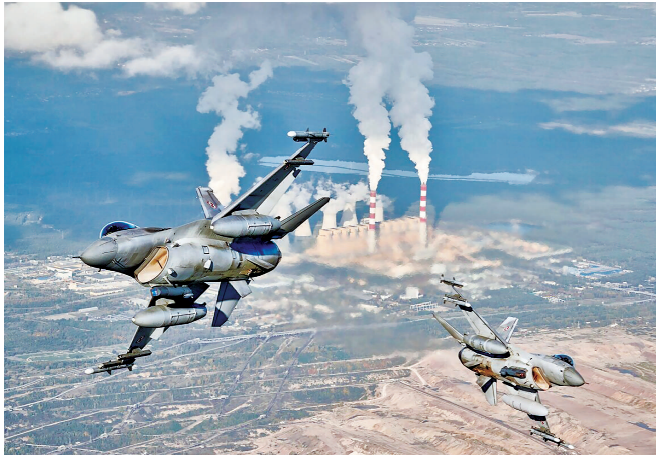
F-16战斗机参加北约演习。

据悉,此次演习主要是演练北约“核共享”政策的相关能力。一直以来,北约的“核共享”政策备受争议。所谓北约“核共享”,是指美国在北约盟国领土上部署核武器,北约成员国以提供基地、战斗机等方式参与北约核活动,从而获得核威慑能力。此前,北约已宣称有7个拥有能发射核武器军用飞机的北约成员国加入“核共享”计划。其中5个国家分别是美国、德国、意大利、比利时和荷兰。有消息称,土耳其为第6个国家,其部分F-16战斗机可能具备投掷美国B61型核炸弹的能力。还有推测称,第7个国家或为希腊。虽然2001年美国核武器已撤离希腊,但希腊军队中仍保留有相关预备役单位和任务计划,且希腊