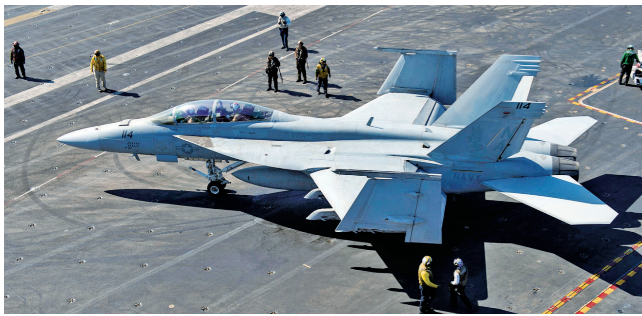
停放在航母甲板上的F/A-18战斗机。