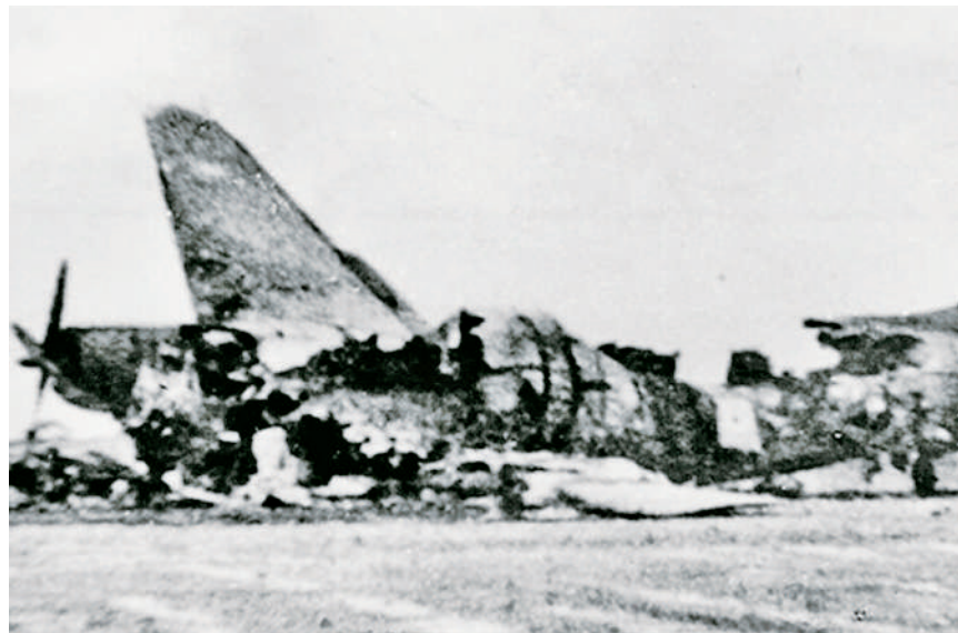
夜袭阳明堡战斗中被炸毁的敌机。

广泛动员，积极备战。 抗战初期，日军一直处于战略进攻态势，气焰十分嚣张，使得一些人滋生出恐惧情绪，