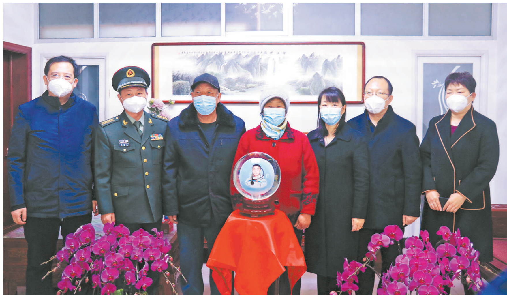
春节前夕，河北省衡水市军地领导来到神舟十四号载人飞船航天员蔡旭哲家中，为航天员家人送上新春祝福。