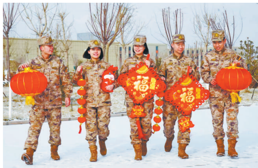
春节将至，火箭军某部洋溢着喜庆祥和的节日氛围。图为该部官兵准备扮靓营房。