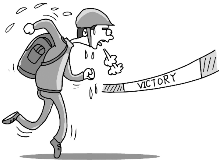
成功的秘诀就在于,坚持到最后一分钟。郭蒙图/文