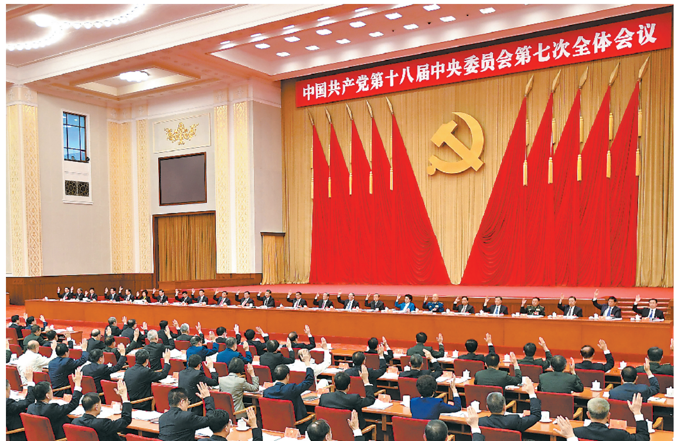
中国共产党第十八届中央委员会第七次全体会议,于2017年10月11日至14日在北京举行。中央政治局主持会议。