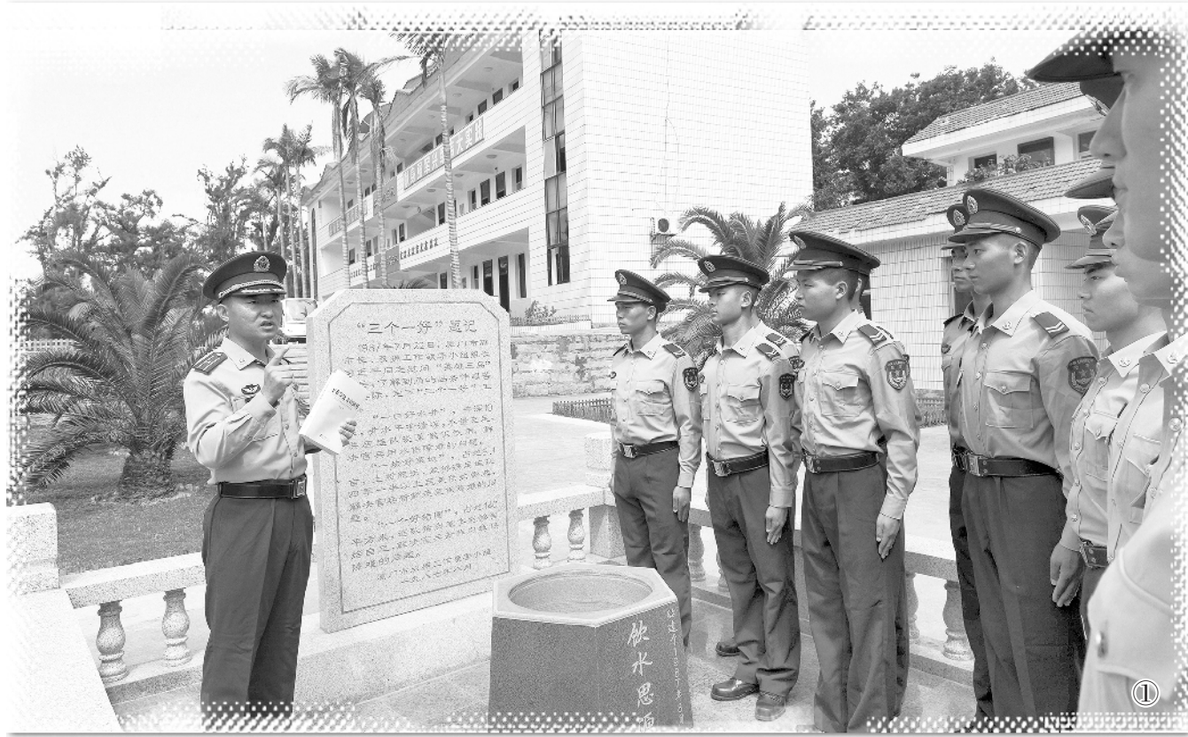
●把生命之根、理想之根、奋斗之根深扎于海岛的泥土中,这,正是角屿十连官兵爱岛守岛、忠诚作为的原因所在