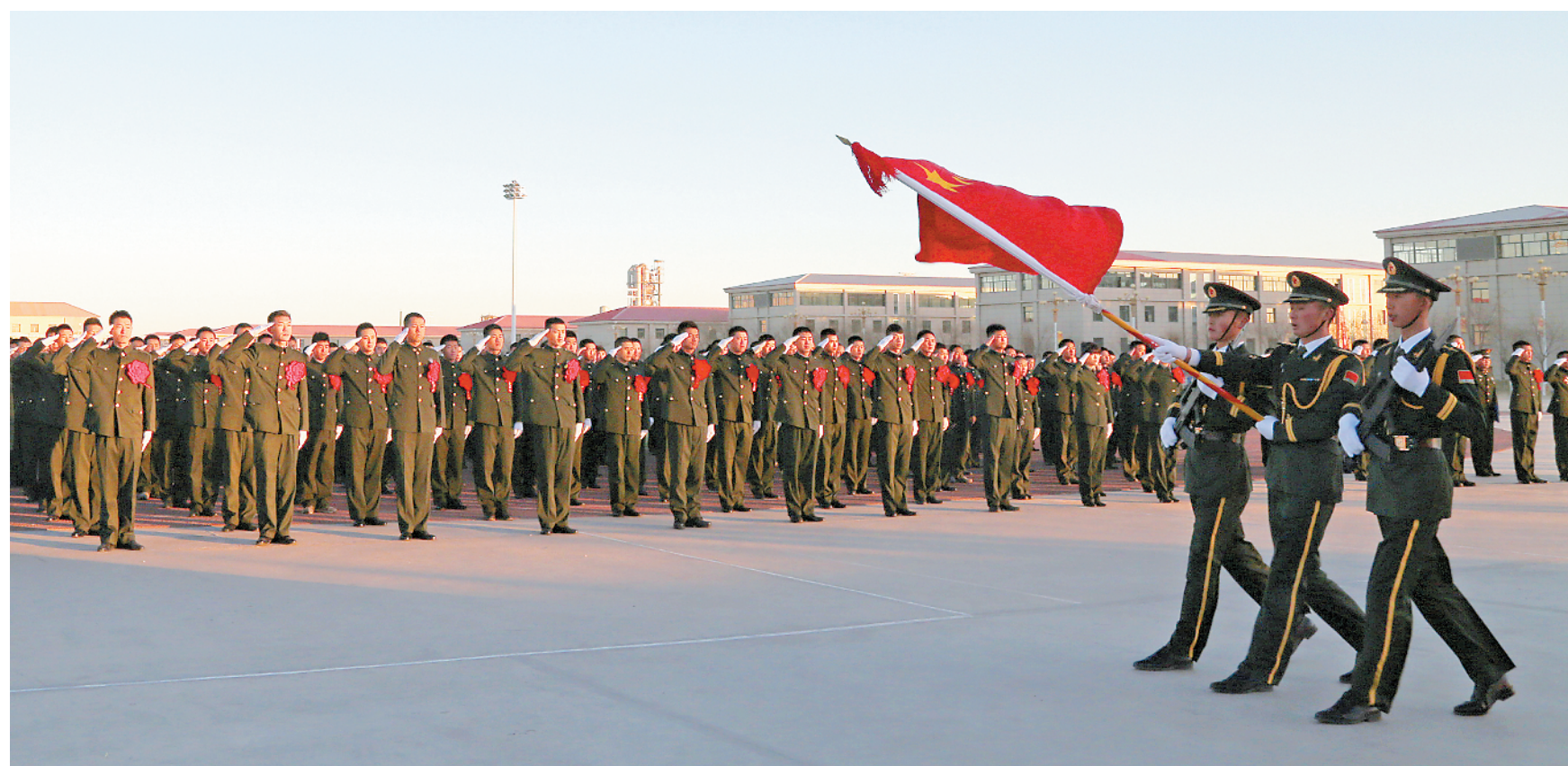
陆军第76集团军某旅今冬退伍老兵向军旗告别。