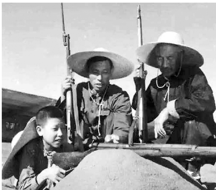
吕家祖孙三代民兵切磋射击本领。

1963年底，总参谋部在江苏镇江召开有各大军区、军事院校领导干部共2000余人参加的郭兴福教学法现场表演会。