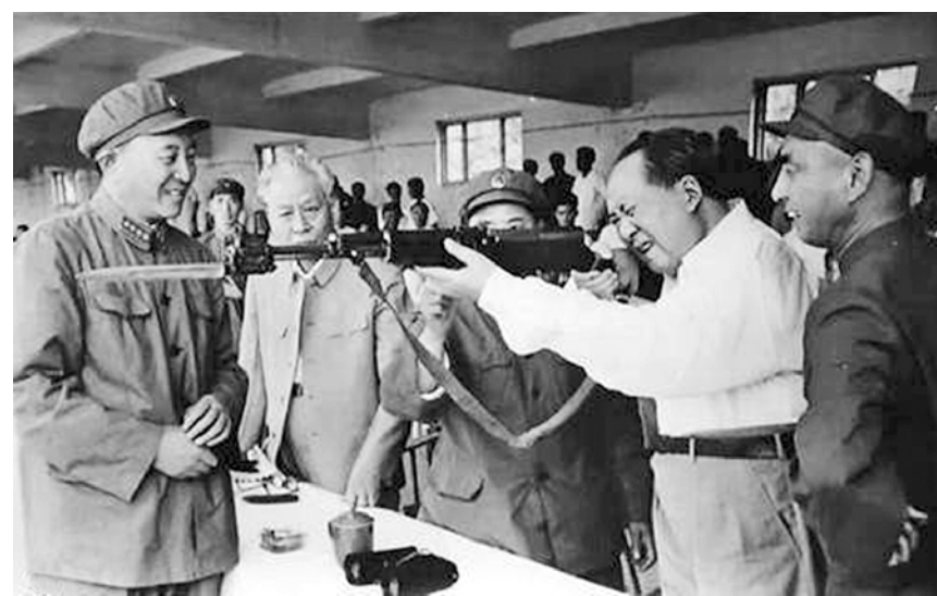
毛主席举起宋世哲的五六式半自动步枪做出瞄准动作。

由于射击成绩突出，1964年6月，一家三代民兵随济南军区军事表演部队，到北京向党和国家领导人表演步枪射击。当时，全国民兵代表只有7人，