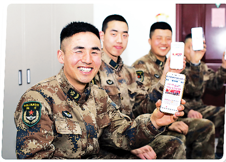
上图：3月8日，新疆军区某团官兵通过解放军报客户端了解两会新闻，组织学习讨论。