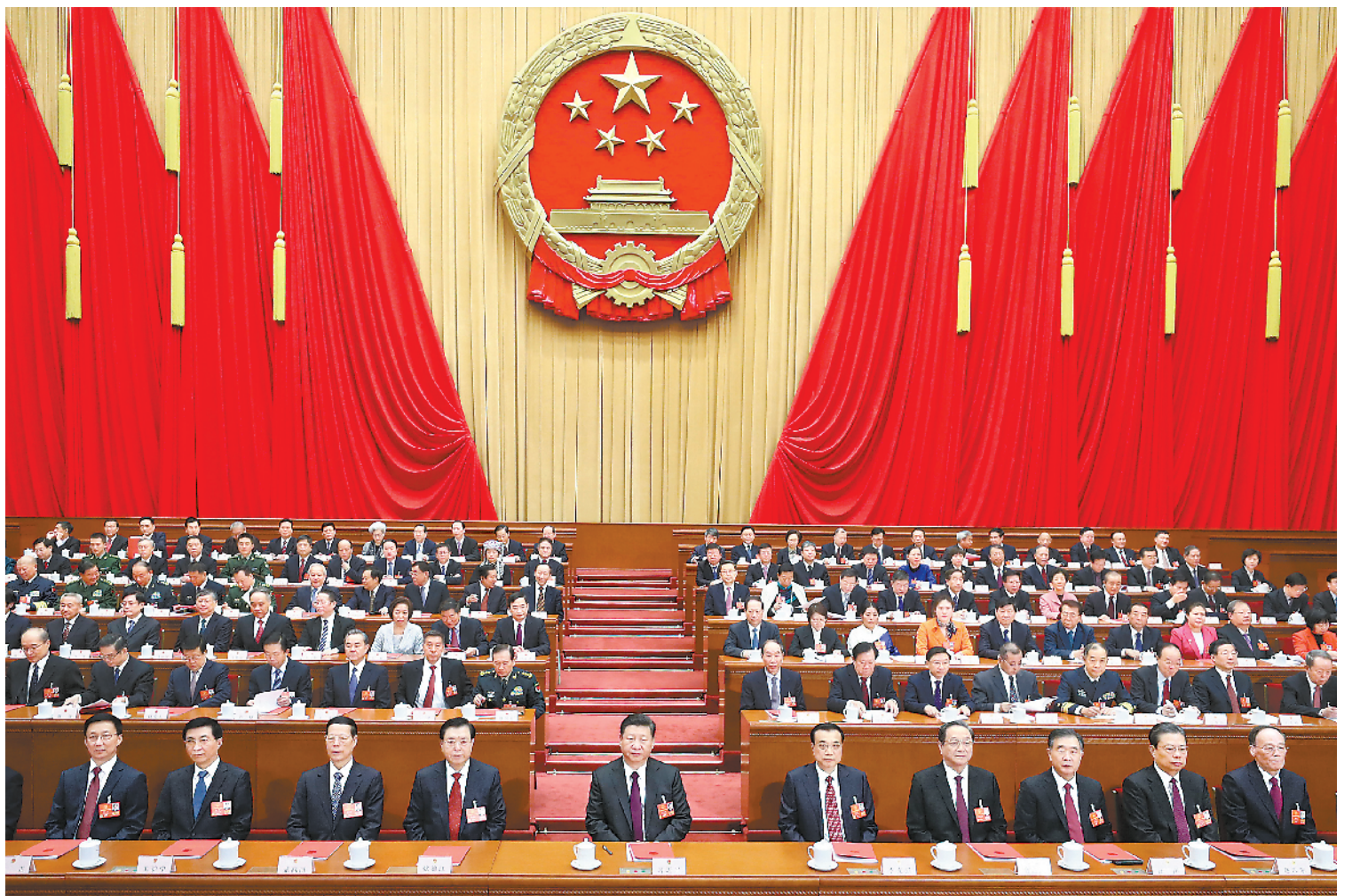
3月20日,第十三届全国人民代表大会第一次会议在北京人民大会堂闭幕。中共中央总书记、国家主席、中央军委主席习近平发表重要讲话。