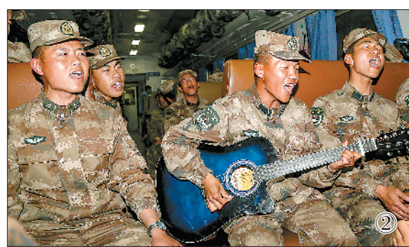
图①：即将奔赴阿里高原，新战士精神抖擞。 图②：新战士们在火车上高唱军歌。 图③：新战士在飞机上用手机拍摄高原美景。 图④：新战士们到达阿里昆莎机场。

经过90分钟的飞行，新战士顺利到达阿里昆莎机场。再过几天，他们将奔赴各边防连队，在高原边境线上为祖国和人民站岗放哨，书写崭新的军旅人生篇章。