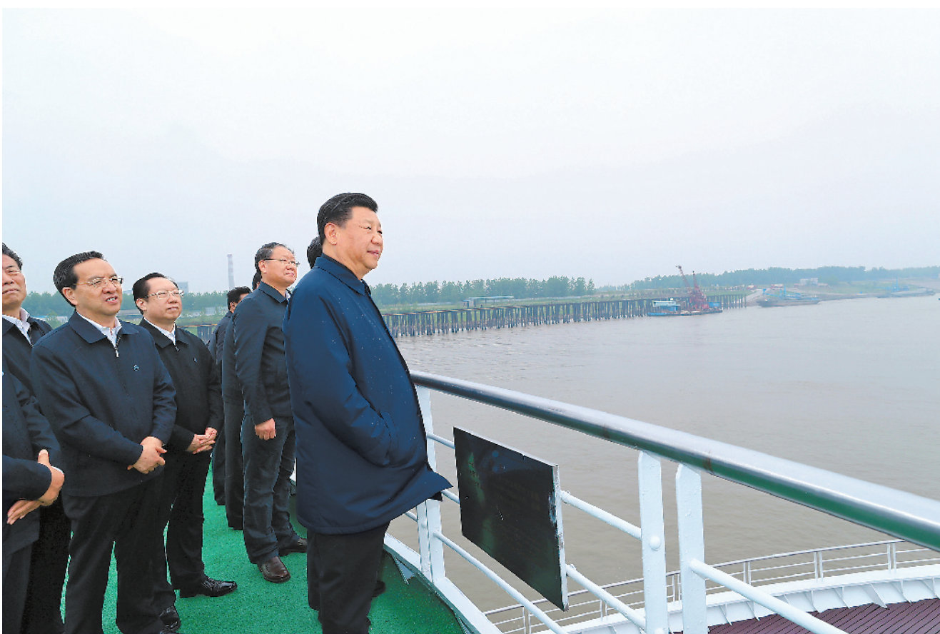
4月26日下午，中共中央总书记、国家主席、中央军委主席习近平在武汉主持召开深入推动长江经济带发展座谈会并发表重要讲话。这是座谈会前，习近平于25日上午乘船沿江察看两岸生态环境和发展建设情况。