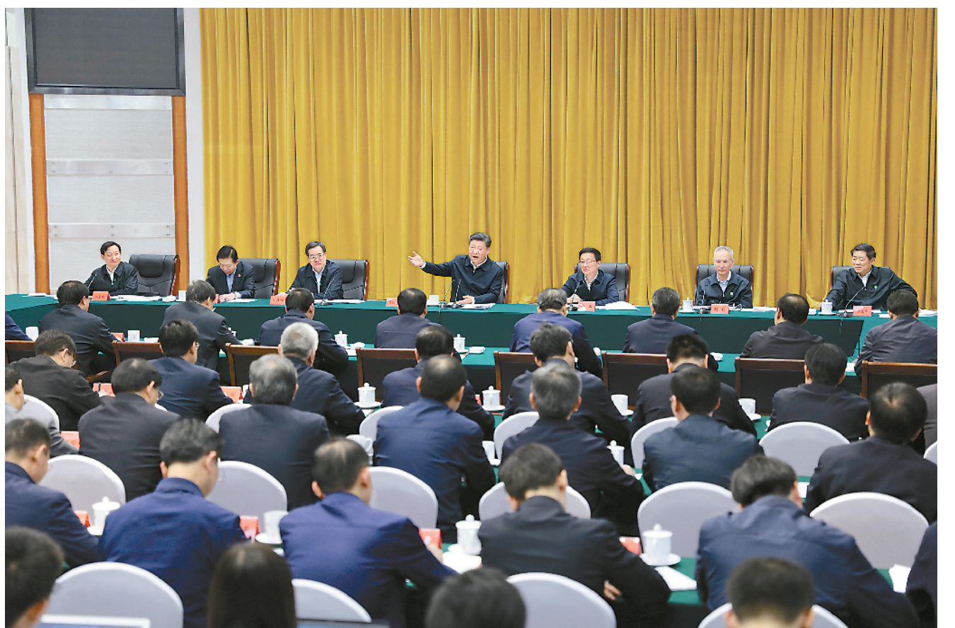
4月26日下午，中共中央总书记、国家主席、中央军委主席习近平在武汉主持召开深入推动长江经济带发展座谈会并发表重要讲话。