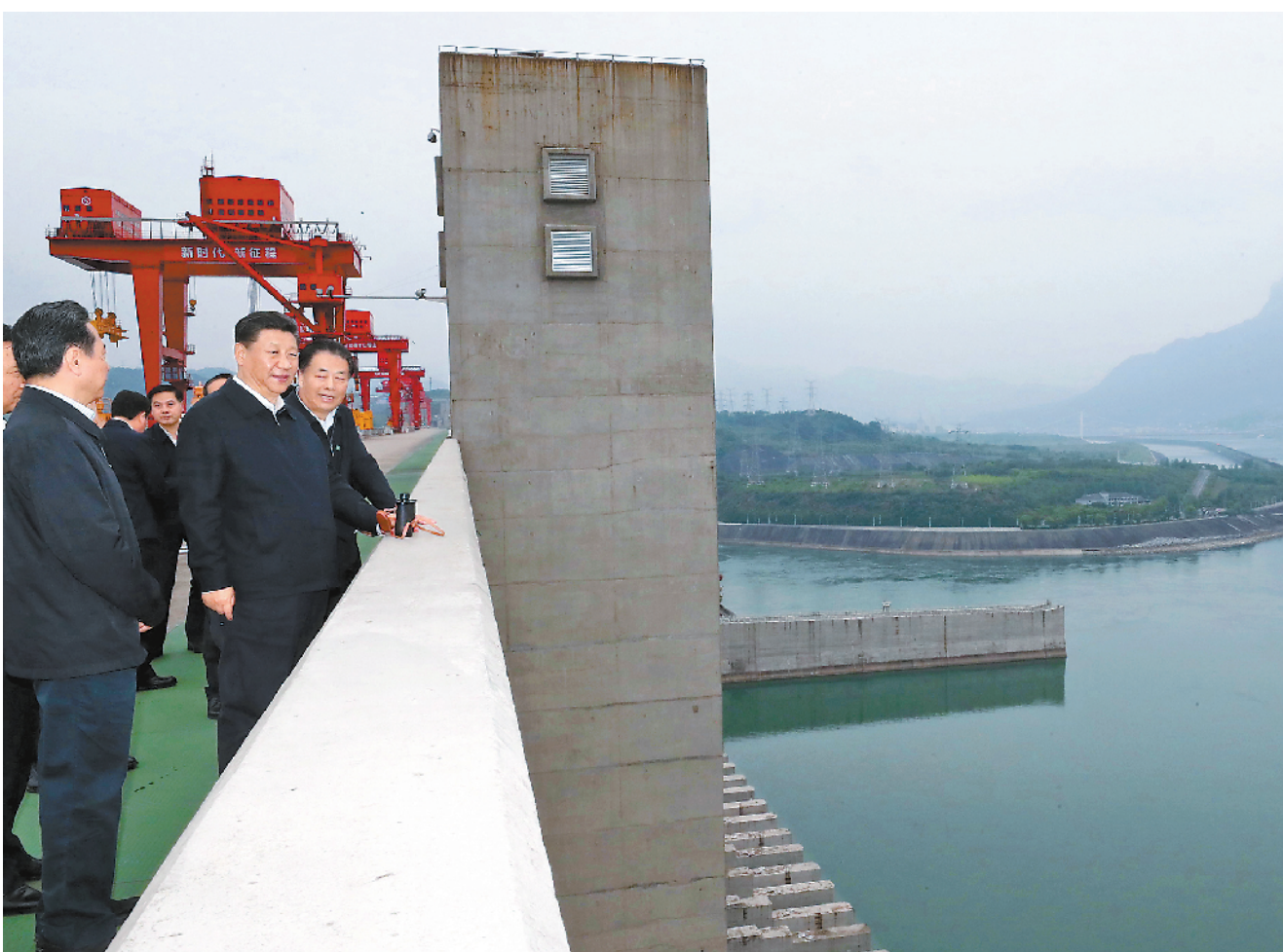
4月26日下午，中共中央总书记、国家主席、中央军委主席习近平在武汉主持召开深入推动长江经济带发展座谈会并发表重要讲话。这是座谈会前，习近平于24日下午在三峡大坝坝顶察看三峡工程和坝区周边生态环境。