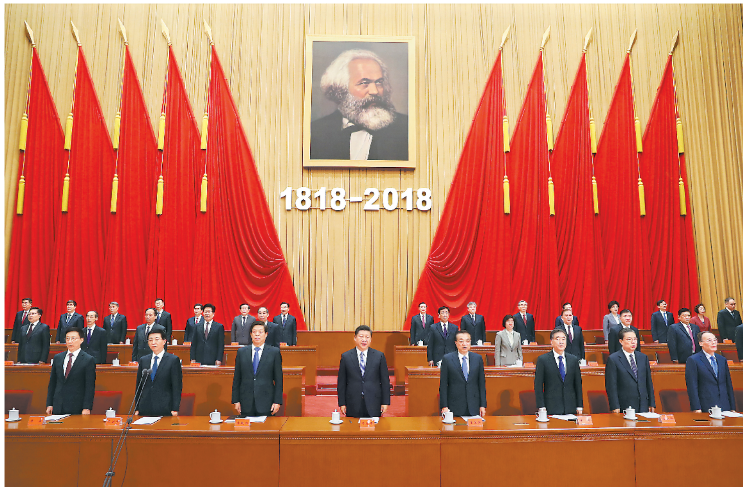
5月4日，纪念马克思诞辰200周年大会在北京人民大会堂隆重举行。中共中央总书记、国家主席、中央军委主席习近平在大会上发表重要讲话。