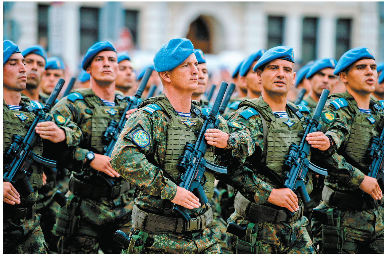
5月6日，保加利亚在首都索菲亚举行盛大阅兵式，庆祝军队节。

合作。 此外，“反恐处突中的电子对抗论坛”“测绘地理信息技术与装备峰会”“2018未来装备创新发展论坛暨装备信息化、智能化、无人化关键技术研讨会”和“第八届国际测试仪器应用技术大会”4场专业论坛同期举办。