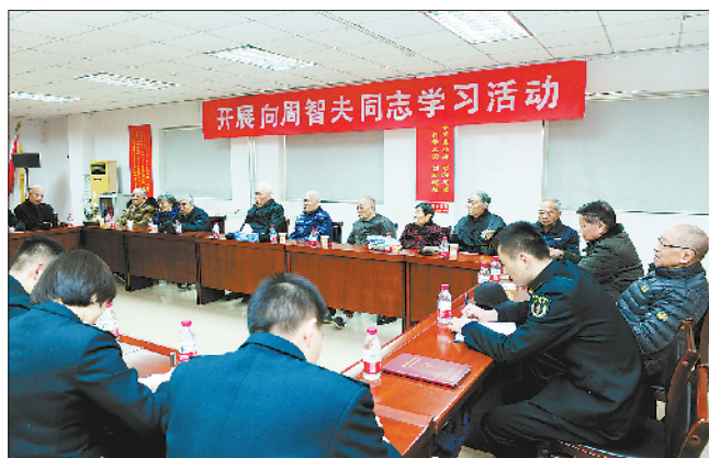
◇ 某干休所开展向周智夫同志学习活动。