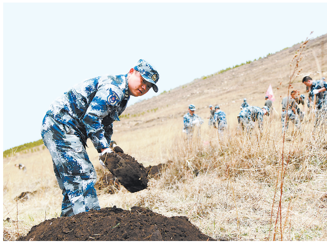
5月上旬，中部战区空军某旅官兵在2022年冬奥会举办城市张家口崇礼参加义务植树活动。该旅官兵先后多次参加驻地组织的环境保护和绿化山川等活动，共计植树10万余株，绿化荒地近千亩。

美丽中国，你我共享，你我共建。习主席在视察部队时多次指出，要支持和参加地方生态文明建设。加大力度推进新时代生态文明建设，是军队贯彻落实党的十九大关于建设“富强民主文明和谐美丽的社会主义现代化强国”战略部署的内在要求。全军官兵要倡导绿色发展理念，大力推广绿色消费，坚持节约资源和保护环境的基本国策，像保护眼睛一样保护生态环境，像对待生命一样对待生态环境。要增强生态安全和生态危机意识，加强快速反应和应急力量建设，有效处置重大生态灾难和意外突发事件。要深入开展绿色营区、生态管区创建活动，不断改善营区环境质量。要充分利用自身资源和优势，积极支援地方植树造林，让祖国大地不断绿起来美起来，为国家生态文明建设作出应有贡献。