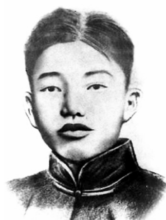
史砚芬像(资料照片)。

1928年9月27日，一位年轻人在南京雨花台高唱雄浑悲壮的《国际歌》，眼神坚定有力。一声无情的枪响，他倒在血泊中，从容走完了生命的最后一程。他就是雨花英烈史砚芬。