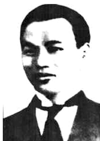
陈乔年像(资料照片)。

“让我们的子孙后代享受前人披荆斩棘的幸福吧！”这句被铭刻在上海龙华烈士纪念馆陈列室墙上的话，是1928年6月6日牺牲在上海龙华的陈乔年烈士就义前的慷慨陈词。牺牲时，陈乔年年仅26岁。 陈乔年，安徽怀宁人，陈独秀次子，生于1902年。1915年入上海法语补习学校学习，两年后进入震旦大学学习。1919年底赴法勤工俭