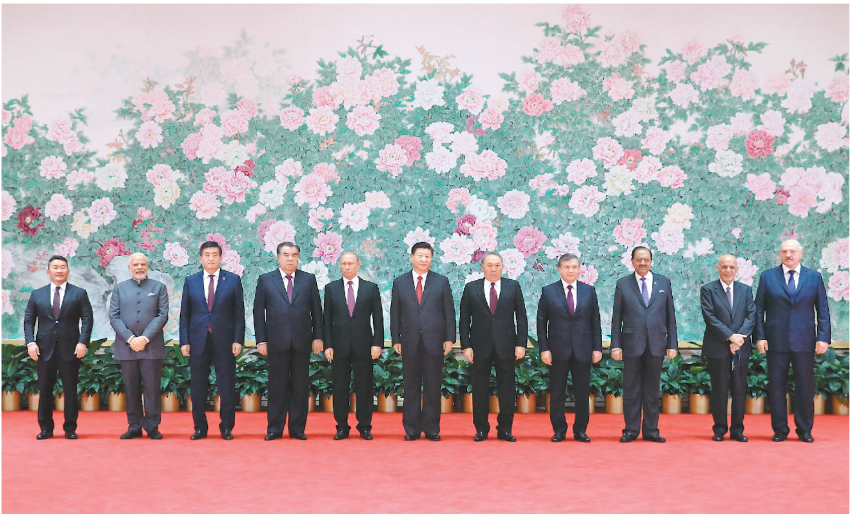
6月9日,国家主席习近平在青岛国际会议中心举行宴会,欢迎出席上海合作组织青岛峰会的外方领导人。这是习近平同外方领导人在巨幅工笔画《花开盛世》前合影留念。