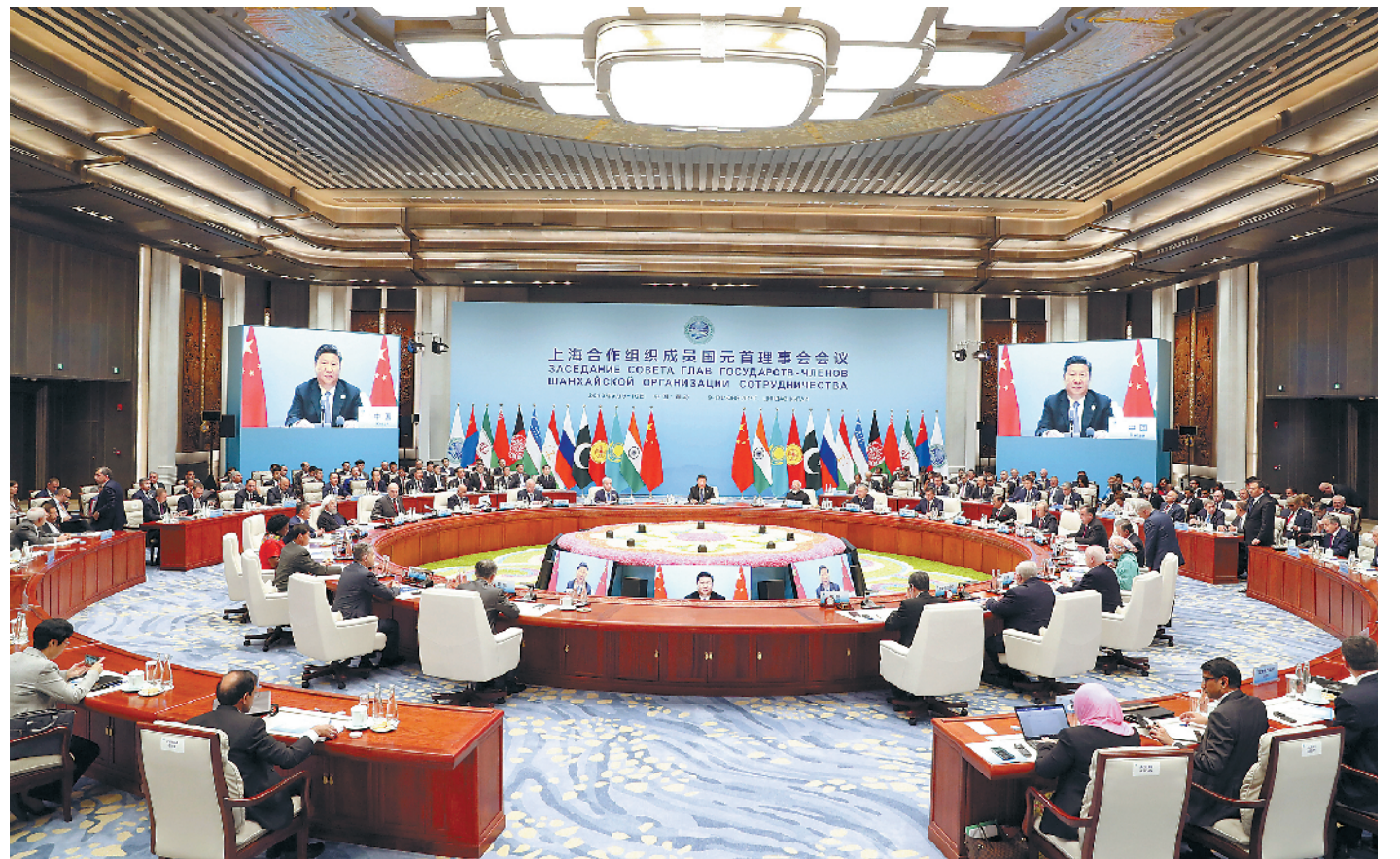
6月10日,上海合作组织成员国元首理事会第十八次会议在青岛国际会议中心举行。国家主席习近平主持会议并发表重要讲话。

新华社青岛6月10日电 (记者余孝忠、朱超)上海合作组织成员国元首理事会第十八次会议10日在青岛国际会议中心举行。中国国家主席习近平主持会议并发表重要讲话。上海合作组织成员国领导人、常设机构负责人、观察员国领导人及联合国等国际组织负责人出席会议。与会各方共同回顾上海合作组织发展历程,就本组织发展现状、任务、前景深入交换意见,就重大国际和地区问题协调立场,达成了广泛共识。