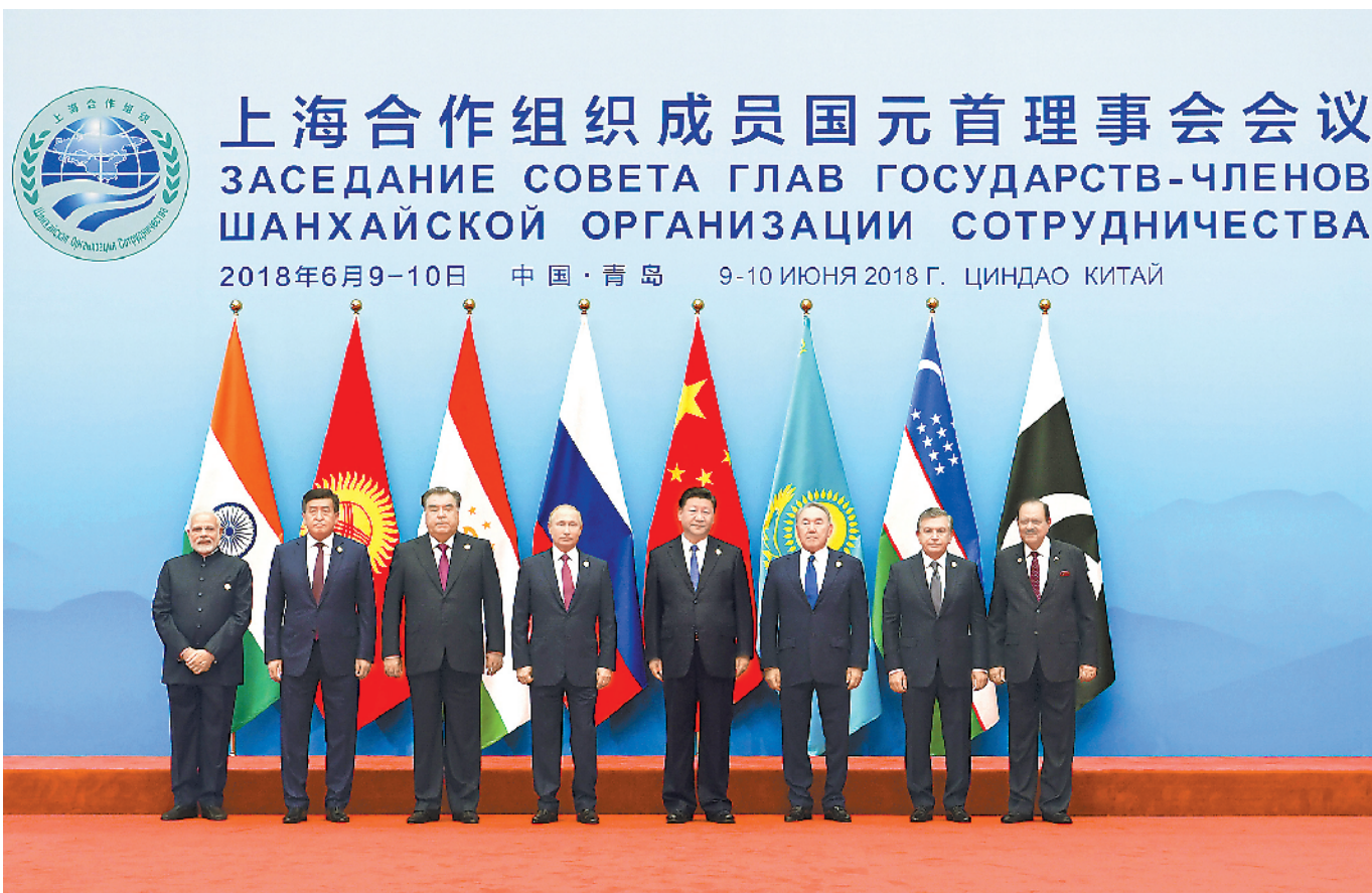
6月10日,上海合作组织成员国元首理事会第十八次会议小范围会谈在青岛国际会议中心举行。国家主席习近平主持。这是上海合作组织成员国领导人集体合影。

新华社青岛6月10日电 (记者孙奕、温馨)上海合作组织成员国元首理事会第十八次会议小范围会谈10日在青岛国际会议中心举行。国家主席习近平主持。印度总理莫迪、哈萨克斯坦总统纳扎尔巴耶夫、吉尔吉斯斯坦总统热恩别科夫、巴基斯坦总统侯赛因、俄罗斯总统普京、塔吉克斯坦总统拉赫蒙、乌兹别克斯坦总统米尔济约耶夫出席会议。各成员国领导人就上海合作组织发展以及重大国际和地区问题交换意见。