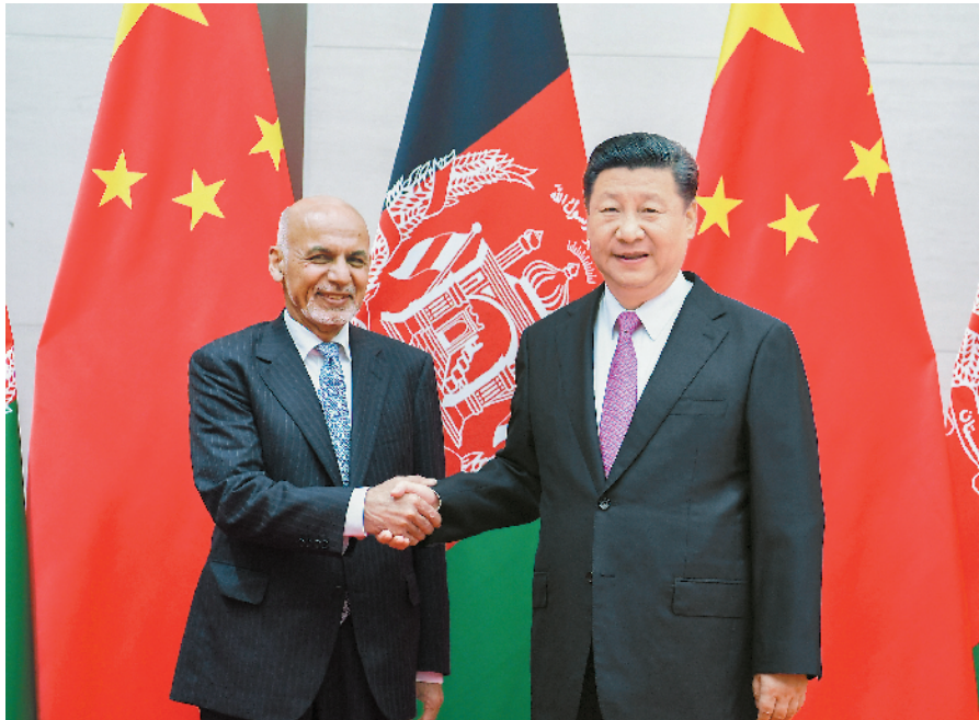
6月10日,国家主席习近平在青岛会见阿富汗总统加尼。