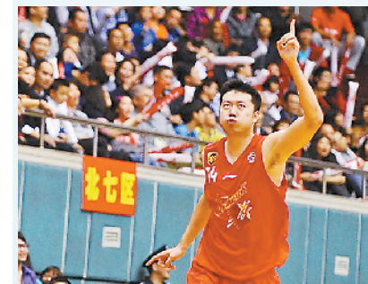
王治郅,八一男篮的旗帜性人物,曾率八一队在国内赛场所向披靡。2001年,王治郅加盟达拉斯小牛队,成为中国篮球界登陆NBA第一人。