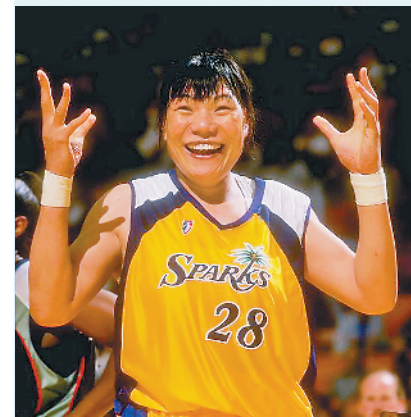
郑海霞,八一队和中国女篮历史上的第一中锋,1992年奥运会率队率领中国女篮获得亚军,创造了中国女篮历史。1996年,郑海霞登陆WNBA。