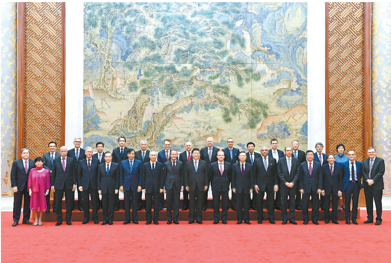
6月21日,国家主席习近平在北京钓鱼台国宾馆会见出席“全球首席执行官委员会”特别圆桌峰会的知名跨国企业负责人,并同他们座谈交流。

新华社北京6月21日电 (记者侯丽军)国家主席习近平21日在钓鱼台国宾馆会见出席“全球首席执行官委员会”特别圆桌峰会的知名跨国企业负责人,并同他们座谈交流。