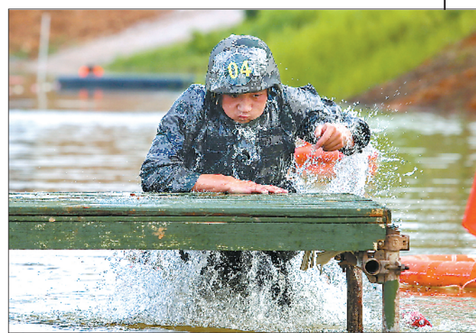
特战队员进行水中越障课目考核比武。