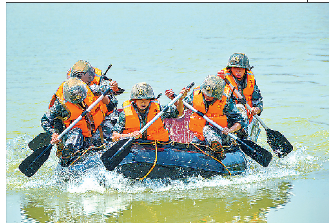
女兵小队操纵橡皮艇奋力前行。