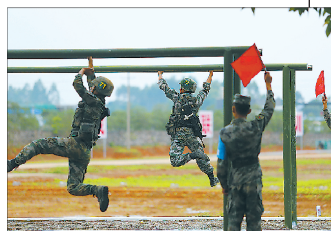
士官战斗体能考核比武,比拼体能素质。