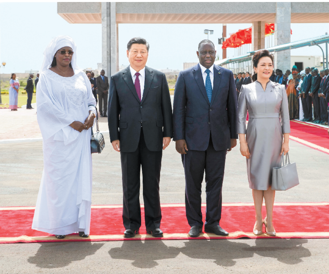
七月二十一日,国家主席习近平抵达达喀尔,开始对塞内加尔共和国进行国事访问。塞内加尔总统萨勒在机场为习近平举行隆重欢迎仪式。习近平在萨勒陪同下检阅仪仗队。这是检阅后,习近平主席和夫人彭丽媛同萨勒总统和夫人玛丽梅合影留念。