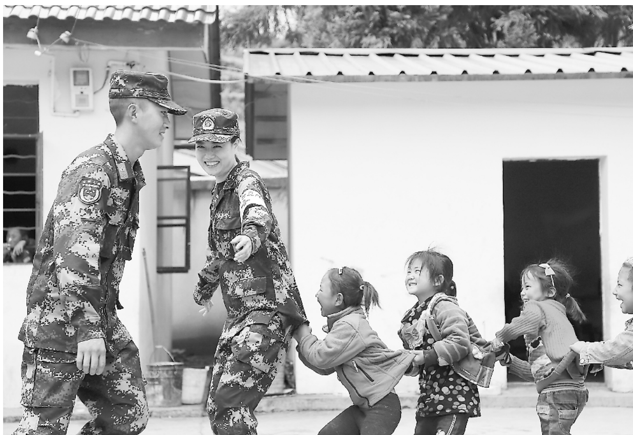
日前，武警四川总队医院医疗小分队深入凉山彝族自治州昭觉县开展医疗扶贫，为上游村的贫困学生送去学习用品，和孩子一起做游戏、教说汉语、教唱军歌。灿烂笑容绽放在彝族孩子和“兵叔叔”“兵阿姨”脸上，场景温馨动人。李华时报

在连队，江波不仅在“诗词界”的地位无人能撼，训练上更是屡获标兵，连年被评为优秀士官、优秀班班长。有战友问江波，年年先进有啥经验。只见他眼睛猛眨了几下，依然是自信而富有磁性的声音：“读古诗词，励志军志。你们要不要跟我一起读诗词？”大家纷纷叫好，连队“诗词诵读兴趣班”没几天就已经开展得有模有样。