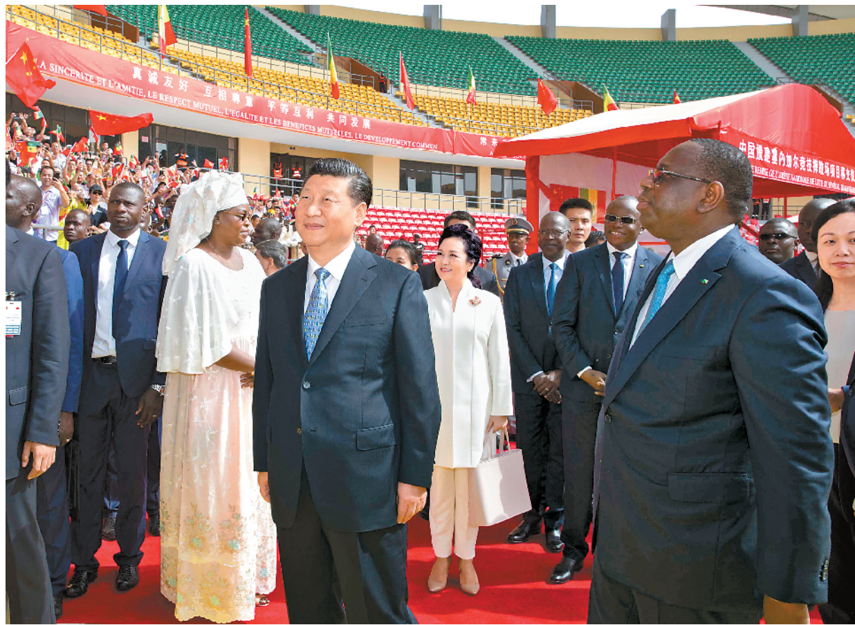
7月22日,国家主席习近平在达喀尔同塞内加尔总统萨勒共同出席塞内加尔竞技摔跤场项目移交仪式。