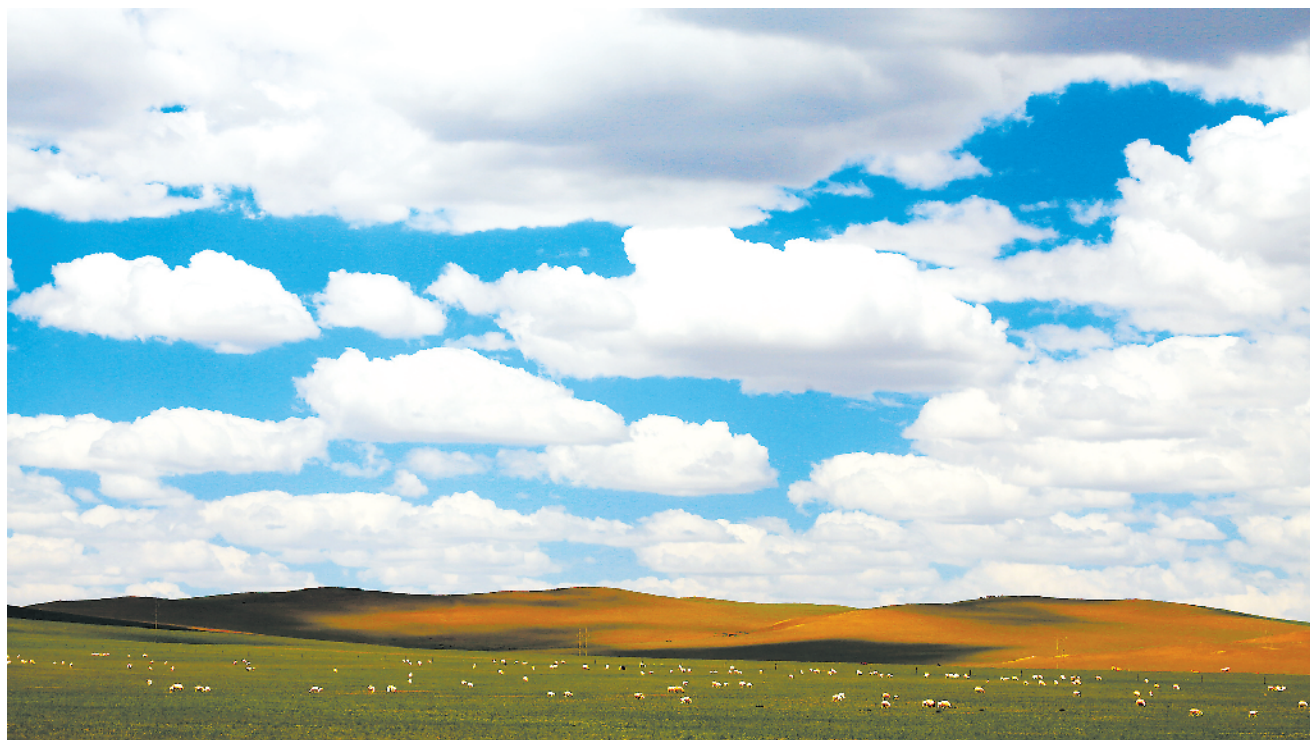
大美中国·草原牧歌