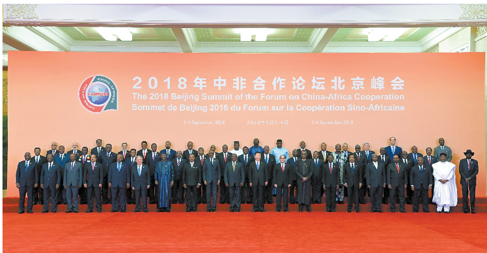
9月3日，中非合作论坛北京峰会在人民大会堂隆重开幕。中国国家主席习近平出席开幕式并发表题为《携手共命运 同心促发展》的主旨讲话。这是开幕式前，习近平同出席论坛峰会的外方领导人集体合影。